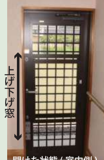
開けた状態 (室内側)