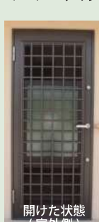
開けた状態 (室外側)